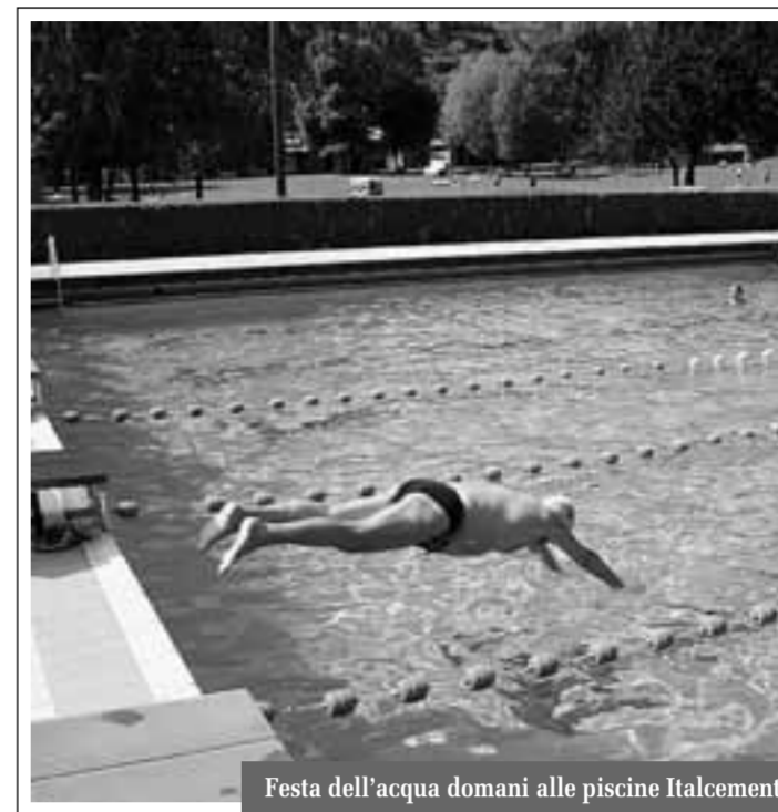
Festa dell'acqua domani alle piscine Italcementi

gustare cibi e bevande, tutti rigorosamente a base di acqua.