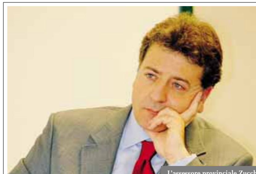
L'assessore provinciale Zucchi

Dati complessivi sulle scelte dei ragazzi di terza media sono stati diffusi anche dall'Ufficio Scolastico Regionale. In Lombardia si è iscritto alle superiori il 95,345% dei ragazzi della scuola di primo grado, pari a 86.509 studenti su 90.730. Quasi l'80% ha scelto la scuola statale, il 6,34% la paritaria. Ai sei licei si è iscritto il 43,13% degli studenti, all'istruzione tecnica il 28,72%, ai professionali l'11,18 degli studenti lombardi e all'Istruzione e formazione professionale regionale il 16,93%.