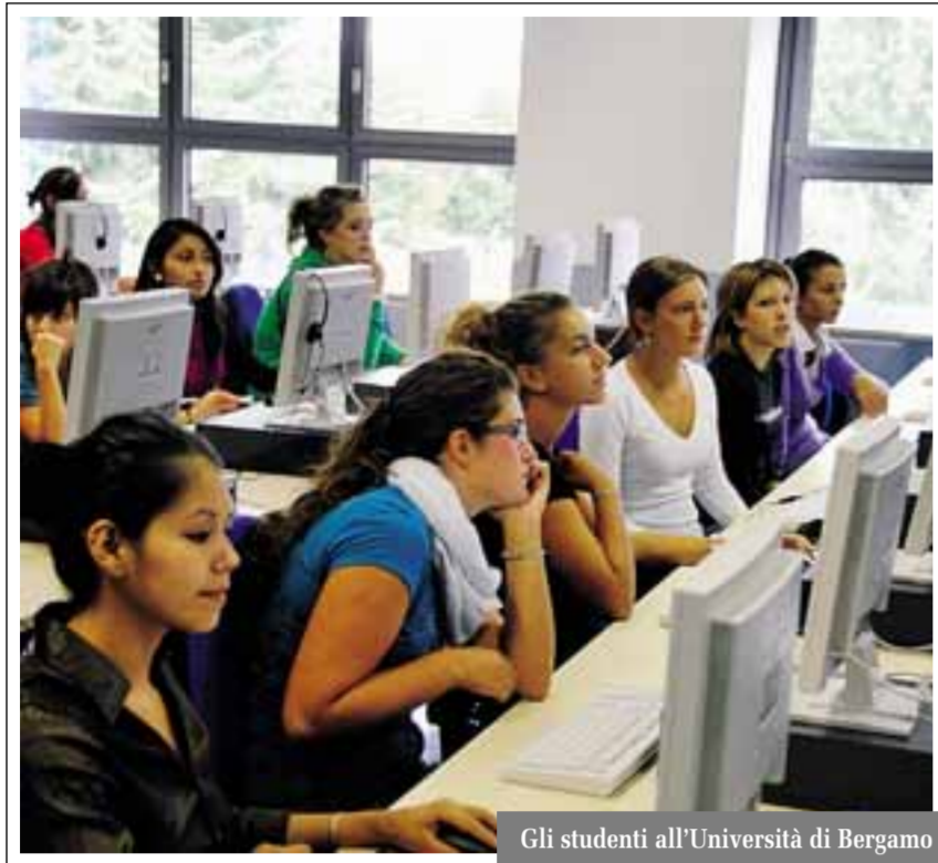
Gli studenti all'Università di Bergamo